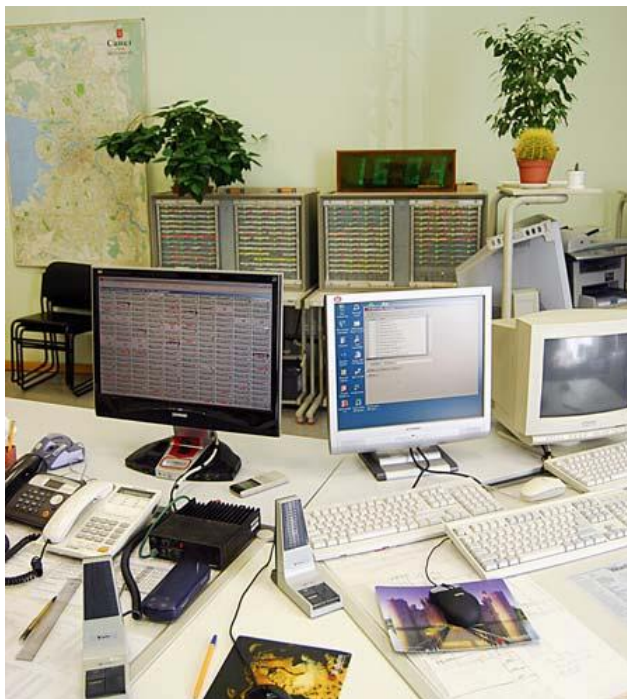
Рис. 2. Центральный диспетчерский пункт ГУП "Ленсвет", с которого управляются более 1000 ПВ

Перспективы развития АСУНО определяются следующими направлениями разработок: дальнейшее повышение надёжности аппаратуры, максимальная централизация контроля с полным охватом всех ПВ, получение полной информации о неисправностях, дистанционная локализация мест возникновения неисправностей и аварий вплоть до неисправности отдельного светильника. Несомненно, что все внедряемые АСУНО будут иметь встроенный учёт расхода электроэнергии.