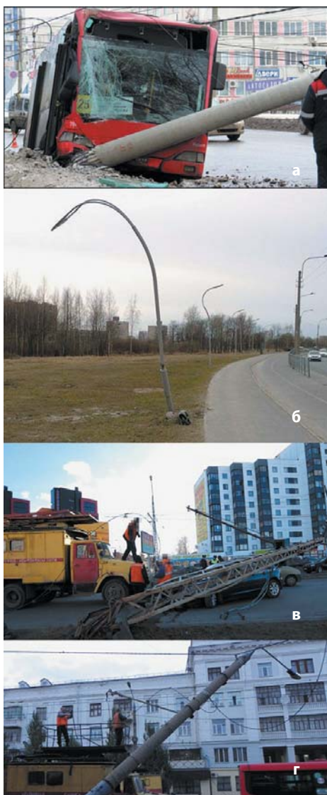
Рис. 2. Примеры повреждений опор освещения

Хорошо известно, что для решения сложных научно-технических и организационных проблем, требующих привлечения серьезных ресурсов, с середины XX в. достаточно широко использовались программы различного масштаба, подпитываемые общественным и/или государственным интересом. В дальнейшей ситуации начала существенно меняться. Так, с окончанием гонки вооружений замедлился прогресс в совершенствовании военной техники. В ряде гражданских